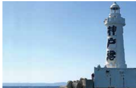
神戸港の入口には手書きで「神戸港」とインパクト大の白灯台がお出迎え！