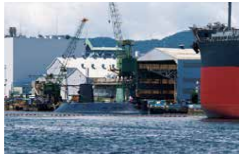
三菱造船で建造中の大型タンカーの建造風景を間近に見学。その大きさに圧倒されます。