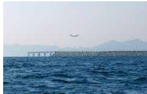
神戸空港マリンエアー。飛行機の離発着する姿を間近で見られます。