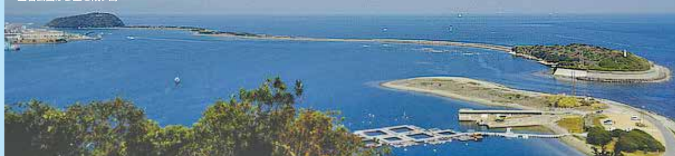
生石公園から望む成ヶ島