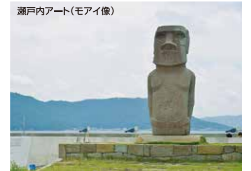
瀬戸内アート(モアイ像)

鬼ヶ島観光協会 〒760-0092 香川県高松市女木町235 TEL.087-840-9055