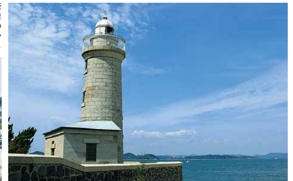
男木島の北端に明治28年に建てられた全国でもめずらしい総御影石造りの灯台は「日本の灯台50選」に選ばれています。

● 男木港一文字防波堤内 34°25'21.7"N 134°03'10.8"E ■ 係留のご予約は 高松市役所 河港課 TEL.087-839-2522 ※土・日・祝祭日除く